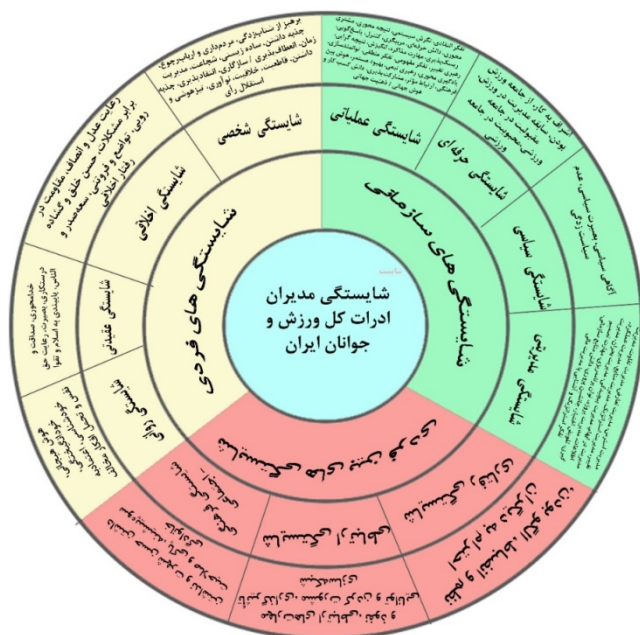
شکل ۲. الگوی نهایی شایستگی‌های مدیران ادارات کل ورزش و جوانان ایران